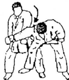
ude kime nage