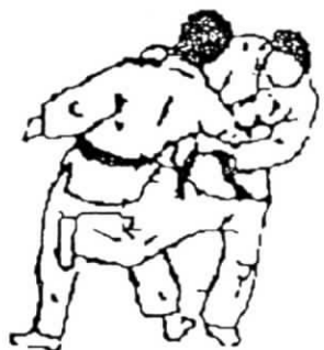
o soto guruma

JUJI GARAMI : PROYECCIÓN LUXANDO EN CRUZ LOS BRAZOS DE UKE