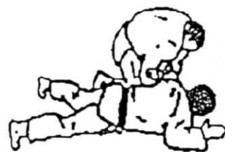
diferentes formas de ude garami