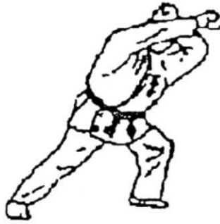
jyodan juji uke