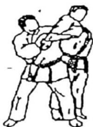
kata ude gatame