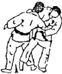
o soto gari