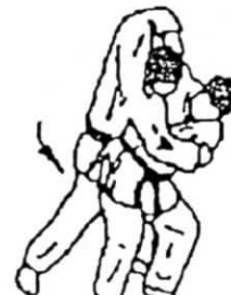
tsuri komi goshi