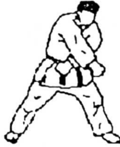
gedan juji uke